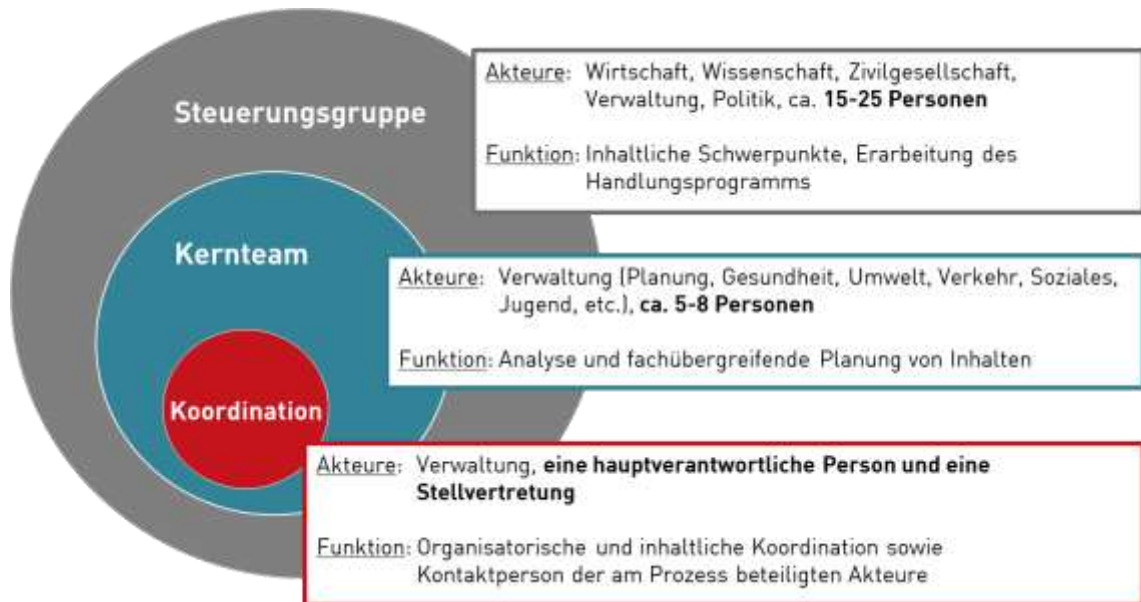
Abbildung 1: Arbeitsstruktur zur Entwicklung der SDG-Aktionspläne

Themenschwerpunkte durch eigene Expertise begleiten. Zudem soll eine Steuerungsgruppe eingerichtet werden, in denen die zentralen kommunalen Akteure/innen aus der Verwaltung, Politik, Zivilgesellschaft (z.B. Vereine), Wirtschaft und ggfs. Wissenschaft vertreten sind.