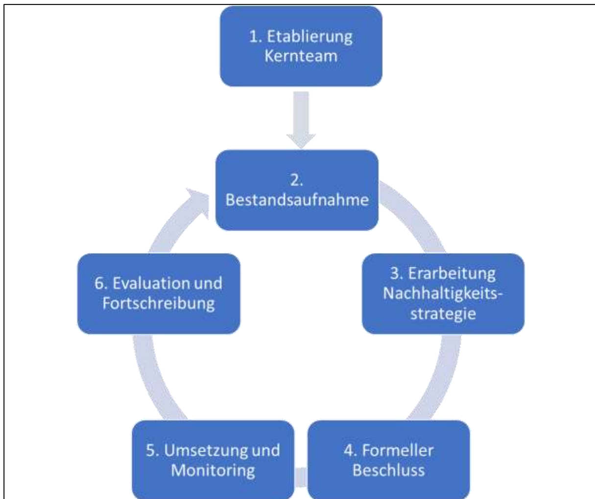
Abbildung 1: Einbettung der Bestandsaufnahme in den Gesamtprozess