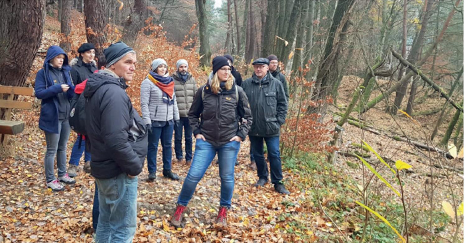
Unterwegs im Beweidungsgebiet bei St. Martin: Klimawandelmanager aus verschiedenen ZENAPA-Gebieten Deutschlands

KlimawandelmanagerInnen informieren sich