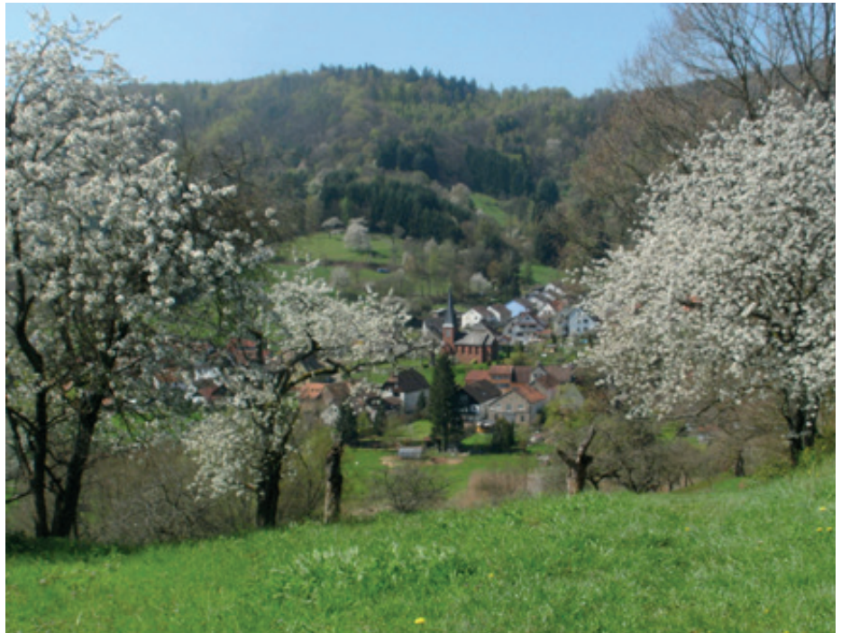
Blick über Streuobstwiesen nach Dernbach

Für die Freistellungsarbeiten ist ein Mann mit Motorsäge an den Hängen rund um Dernbach unterwegs; ebenso ist ein Raupenbagger im Einsatz, mit dem die gerodeten Bäume und Büsche aus dem Gelände entfernt werden. Zudem werden ein Hacker, der Hackschnitzel herstellt, und ein Forstmulcher gebraucht werden, um das Gelände vor erneutem Bewuchs zu schützen. Die Gemeinde Dernbach wird die gerade freigestellte Fläche in ihre schon bestehenden Beweidungsprojekte mit Ziegen, Rindern, Schafen und Pferden integrieren, um auch diese wieder gewonnenen Streuobstwiesen langfristig vor unerwünschtem Bewuchs zu schützen. Einige alte Streuobstbäume bleiben stehen und erhalten einen Pflegeschnitt. Weitere könnten im Projekt gepflanzt werden, wobei darauf geachtet wird, dass