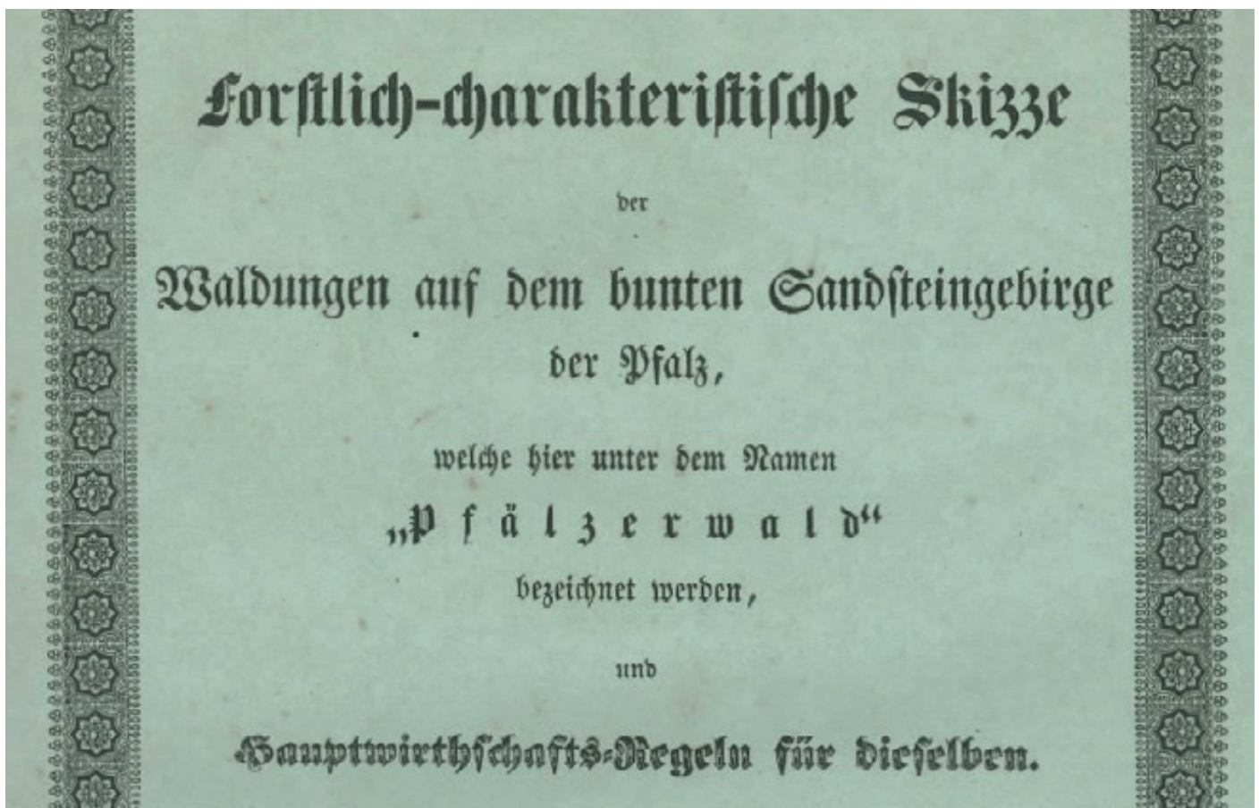
Historisches Dokument mit identitätsstiftender Namensgebung: Die Hauptbewirtschaftungsregeln für den Pfälzerwald von 1843

Die Veröffentlichung steht am Abschluss des Jubiläumsjahres, das das Institut für pfälzische Geschichte und Volkskunde, das Biosphärenreservat Pfälzerwald – beide in Trägerschaft des Bezirksverbands Pfalz – und Landesforsten Rheinland-Pfalz im Juni diesen Jahres mit einer Fachtagung gewürdigt haben.