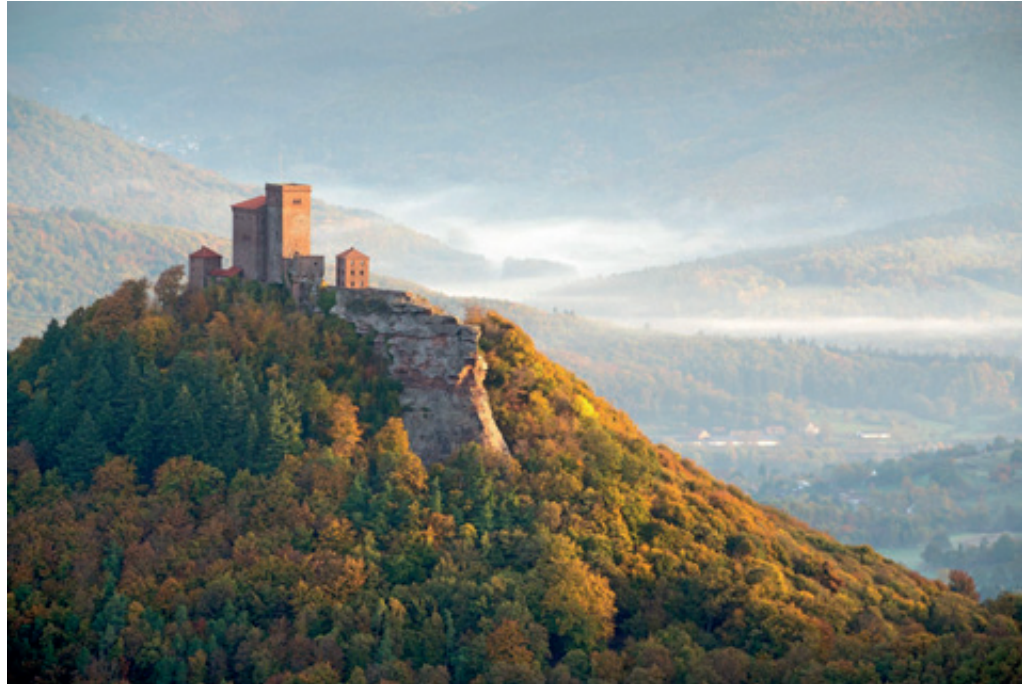
Grenzenlos und unfassbar schön: Das Biosphärenreservat Pfälzerwald-Nordvogesen ist eines von 17 deutschen Biosphärenreservaten und eines von 686 weltweit. Hier die Burg Trifels im Licht der Morgensonne

Die Biosphärenreservate beherbergen in Deutschland einzigartige, meist vom Menschen geprägte Landschaften sowie wertvolle Ökosysteme von Südost-Rügen bis zum Berchtesgadener Land. Sie sind international repräsentative Modellregionen, deren Arbeit ein nachhaltiges Wirtschaften der Menschen fördern und ein tragfähiges Zusammenleben von Mensch und Natur ermöglichen soll. Die deutschen Biosphärenreservate sind eingebunden in das Weltnetz der UNESCO, zu dem aktuell 686 Biosphärenreservate in 122 Ländern gehören. Von den deutschen Biosphärenreservaten sind derzeit 16 als UNESCO-Biosphärenreservate anerkannt. Der Pfälzerwald bildet gemeinsam mit den Nordvogesen das einzige grenzüberschreitende Biosphärenreservat der Bundesrepublik und nur eines von 20 bi- oder trinationalen weltweit.