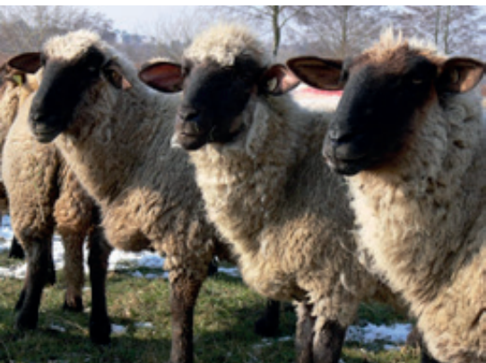
Im Mittelpunkt der Pfälzerwald-Lamminitiative stehen Schafe und ihre Halter

Advent im Stall bei Schafen, Ziegen und Esel