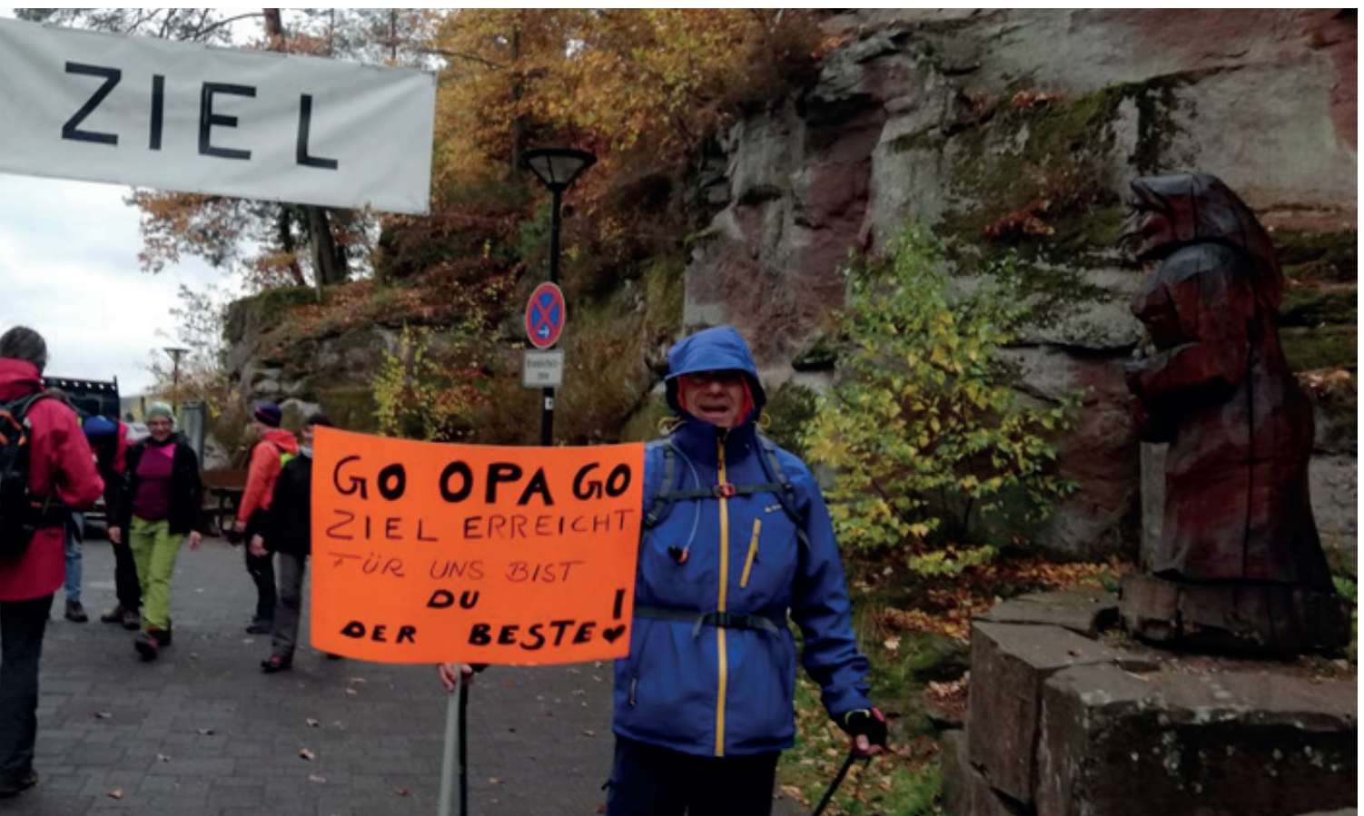
Nasskaltes Wetter, astreine Laune: Wandermarathon-Teilnehmer beim Zieleinlauf in Fischbach

plus, das Haus der Nachhaltigkeit Johanniskreuz und das Biosphärenreservat Pfälzerwald in Trägerschaft des Bezirksverbands Pfalz – freuten sich über die gelungene Gemeinschaftsaktion und versprechen die gleiche Organisationsleistung für den nächsten Marathon am Sonntag, 27. Oktober 2019.