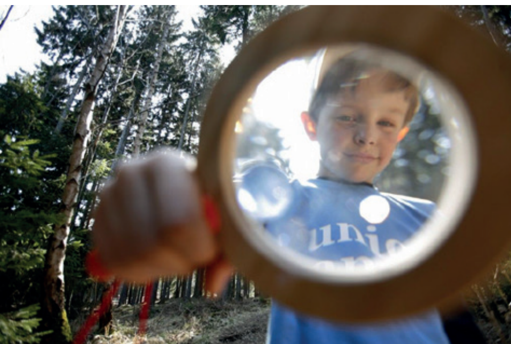
Lernen für die Nachhaltigkeit: Junior Ranger setzen sich aktiv für Natur- und Umweltschutz ein

kreative und spielerische Weise ihre eigene Umwelt kennen und werden für ein aktives Mitwirken in ihrer Heimat oder auch im bundesweiten Netzwerk der Junior Ranger begeistert. Das Programm wird im Biosphärenreservat Pfälzerwald-Nordvogesen gemeinsam mit dem Partnernetzwerk für die Bildung für nachhaltige Entwicklung und mit Unterstützung durch das Land Rheinland-Pfalz umgesetzt.