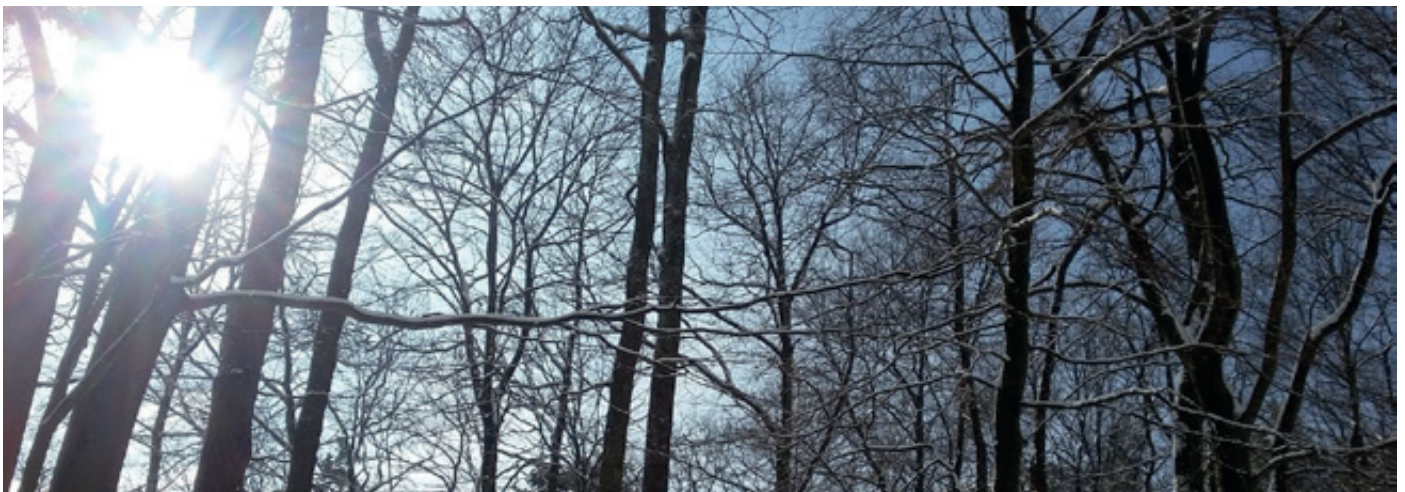
Winter auf der Lolosruhe

Das Team des Biosphärenreservats wünscht frohe Weihnachten und alles Gute für das Jahr 2019!