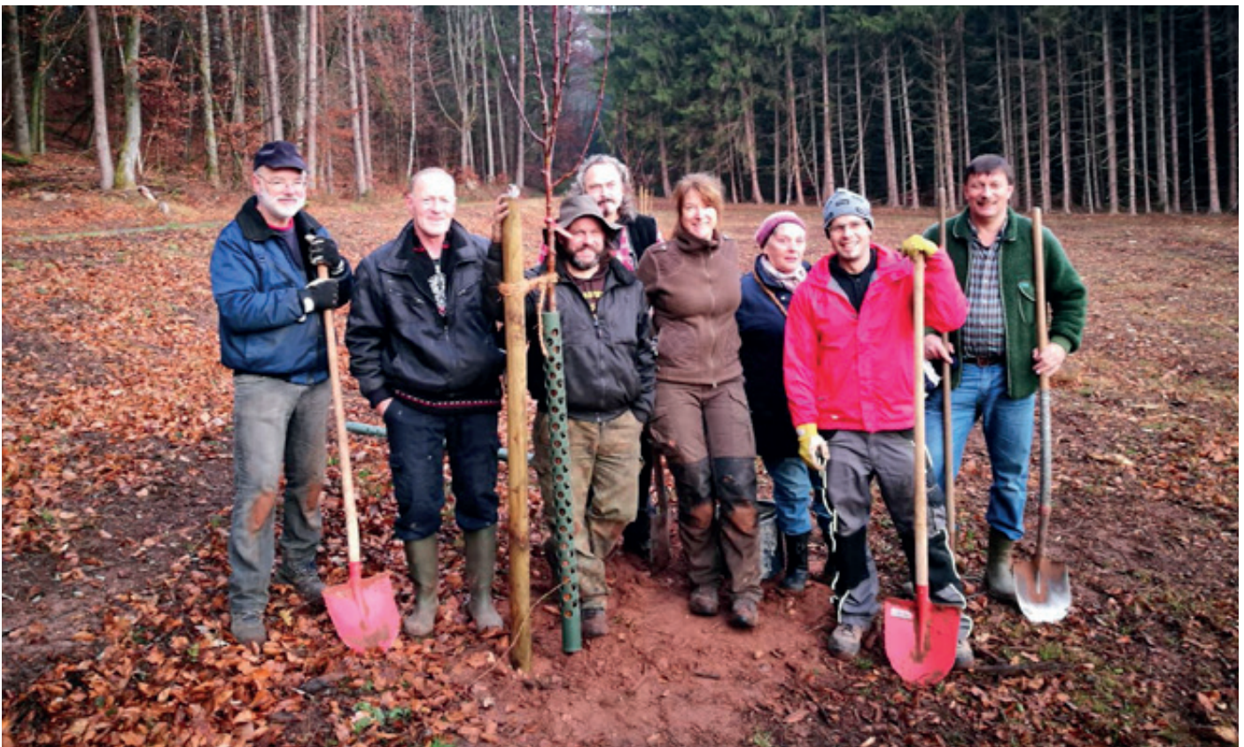
Hier entstehen neue Streuobstwiesen: Baumpflanzaktion bei Schindhard

beiterinnen und Arbeiter mit angepackt haben. Hier gedeihen nun 20 neue Obstbäume zwischen der Burg Berwartstein und dem Campingplatz. Das angrenzende Feuchtgebiet ist jetzt für Besucher wieder sichtbar und auf der Streuobstwiese werden in Zukunft Schafe die Landschaftspflege übernehmen. Somit sind zwei weitere wichtige Trittsteine im deutsch-französischen Biotopverbund etabliert und eine langfristige Offenhaltung sichergestellt. Für das Projekt „LIFE Biocorridors“ werden insgesamt 3,6 Millionen Euro durch die Europäische Union sowie durch die Projektpartner in Frankreich und Rheinland-Pfalz zur Verfügung gestellt. Die Umsetzung der Maßnahmen wird vom Ministerium für Umwelt, Energie, Ernährung und Forsten Rheinland-Pfalz mit 540.000 Euro gefördert.