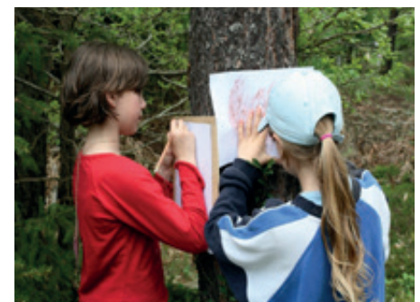
Grenzüberschreitendes Lernen für die Nachhaltigkeit im Biosphärenreservat Pfälzerwald-Nordvogesen

stelle in La Petite-Pierre unter 0033 (0)6 28 10 32 46 oder per E-Mail an r.baghdadi@parc-vosges-nord.fr . Das Projekt wird durch das Umweltministerium Rheinland-Pfalz sowie mit Mitteln aus dem Interreg V A-Projekt „NOE / NOAH“ gefördert. Mehr Infos zum Gärten-Projekt unter www.pfaelzerwald.de/projekte/gaerten