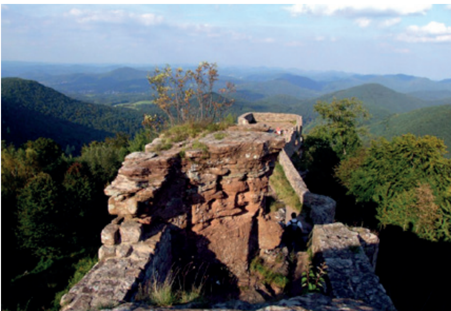
Schönheit und Funktion unseres Biosphärenreservats vermitteln: Das ist unter anderem Aufgabe der Biosphären-Guides

Bei einer Abschlussveranstaltung im Frühjahr 2019 erhalten alle Biosphären-Guides ihr Zertifikat und gehen danach mit unterschiedlichen Angeboten an den Start. Informationen dazu gibt es dann auf www.pfaelzerwald.de .