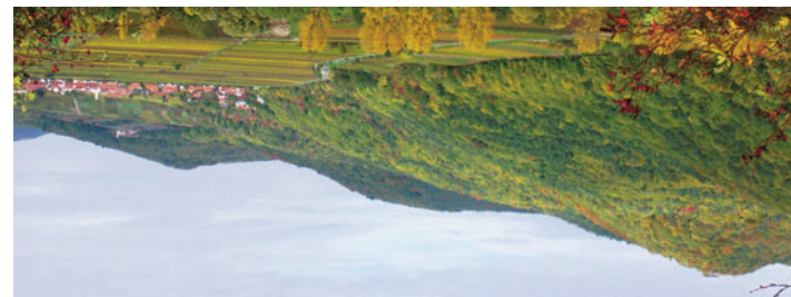
Zweiklang von Wald und Wein

Ein guter Zug für die Umwelt: Dieses Faltblatt ist auf 100% recyceltem Papier gedruckt. Bahn und Umwelt im Internet: www.bahn.de/umwelt Stand: April 2009 VP 65009 Änderungen vorbehalten, Angaben ohne Gewähr.